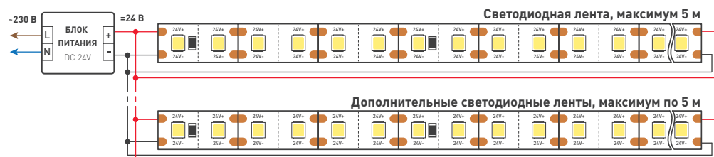
Схема 2. Подключение нескольких светодиодных лент с двух сторон для обеспечения равномерного свечения ленты по всей длине